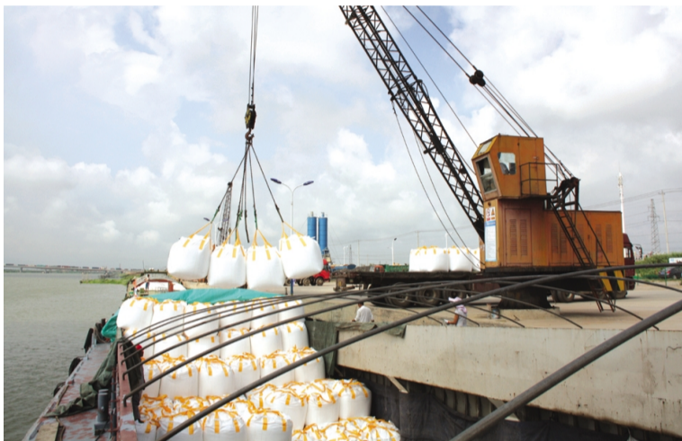
连日来，灌西南洋物流公司码头工人战高温斗酷暑，全力投入到吨袋装卸工作中来。在码头现场，船舱内四面不透风，在烈日的炙烤下，舱内温度高达40多度，为了预防中暑发生，该公司采取每工作20分钟必须休息10分钟的方式，确保作业安全。七月份以来，公司已累计装卸吨袋3万吨。(封 扬)