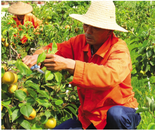
夏季是盆景最佳生长期、培育养护关键期和最好的观赏期。在华茂盆景园展示区，花卉盆景花叶飘香，灌木盆景枝叶青茂，水果盆景果实累累；在苗木培育区，紫藤、金雀、木瓜、海棠等幼苗长势喜人。目前该盆景园有成品盆景600多盆，培育盆景幼苗近10万株。图为园艺工人修剪养护梨、苹果等水果盆景。