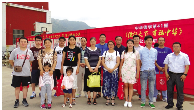
为了在团员青年中弘扬中华优秀传统文化,8月6日至7日,集团公司团委组织25名团员青年参加在朝阳会堂举办的中华德育《德行天下·幸福中华》暨“幸福连云港”公益大讲堂活动。(工团)