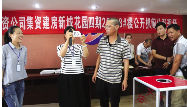
日前,台北投资公司举行职工集资建房分房仪式,对114户集资建房户按流程进行抓阄分房,确保公平、公正、公开。(韩挺)